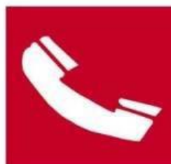
Τηλέφωνο για την καταπολέμηση πυρκαγιών