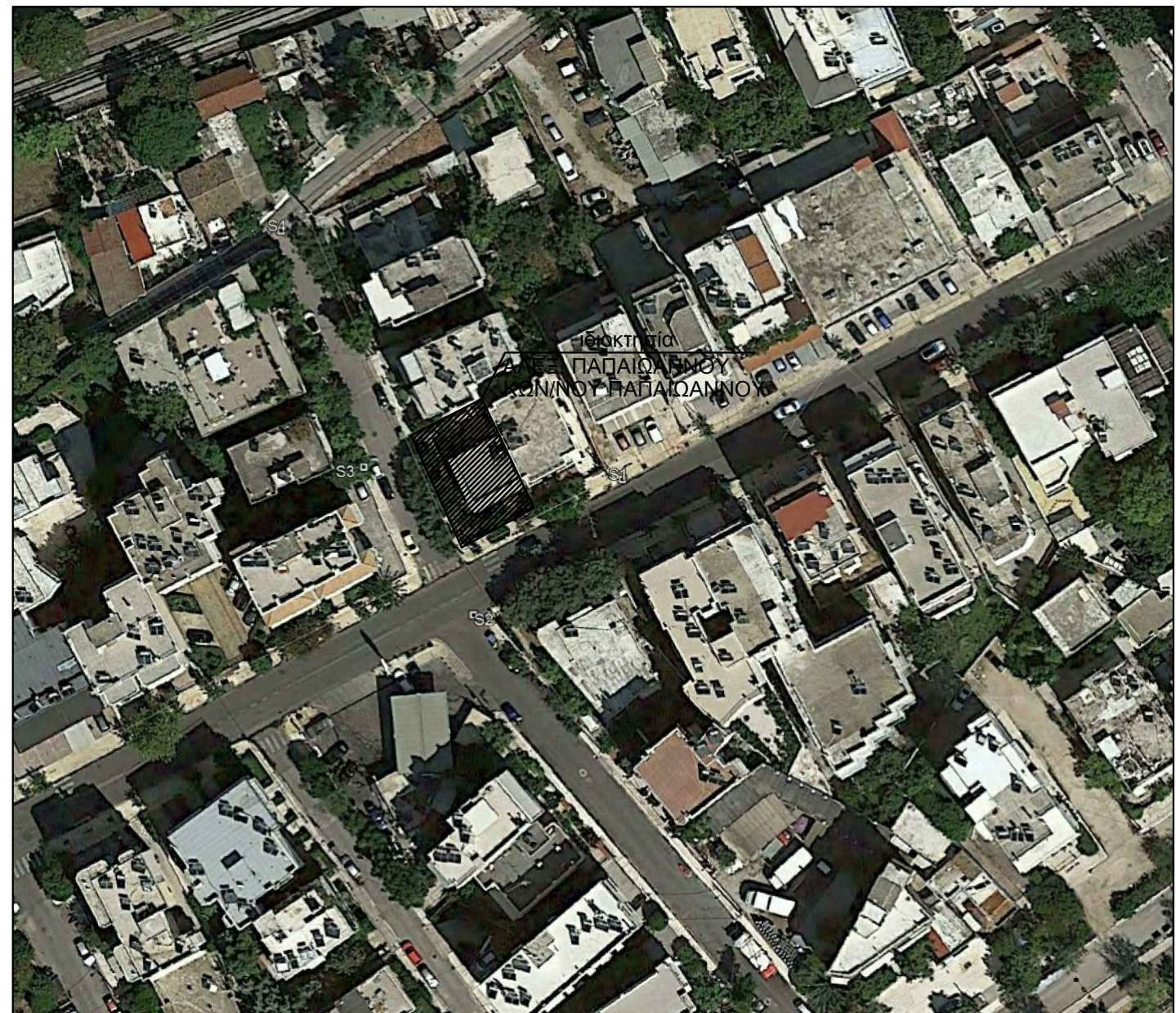
ΑΠΟΣΠΑΣΜΑ ΟΡΘΟΦΩΤΟΧΑΡΤΗ κλίμακας 1 : 1000