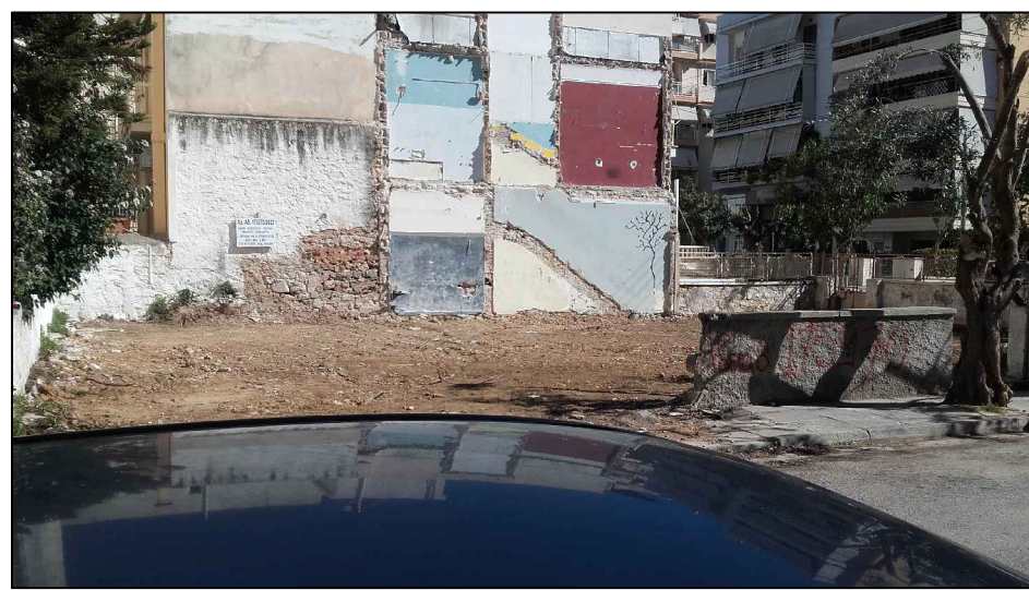
ΦΩΤΟΓΡΑΦΙΑ ΑΠΟ ΘΕΣΗ ΑΛΗΘΗΣ 1

ΣΤΑΥΡΟΣ Τ. ΜΠΟΛΕΤΗΣ ΔΙΠΛ./ΧΩΣ ΠΟΛΙΤΙΚΟΣ ΜΗΧΑΝΙΚΟΣ ΕΘΝΙΚΟΥ ΜΕΤΣΟΒΙΟΥ ΠΟΛΥΤΕΧΝΕΙΟΥ ΜΕΛΟΣ Τ.Ε.Ε. ΑΡΙΘΜΟΣ ΜΗΤΡΩΟΥ 28984 ΕΛΕΥΘ. ΒΕΝΙΖΕΛΟΥ & ΜΑΝΤΖΑΡΙΩΤΑΚΗ 89 ΧΑΛΛΙΔΕΙΑ ΤΗΛ. 210 9511889 - 9524697