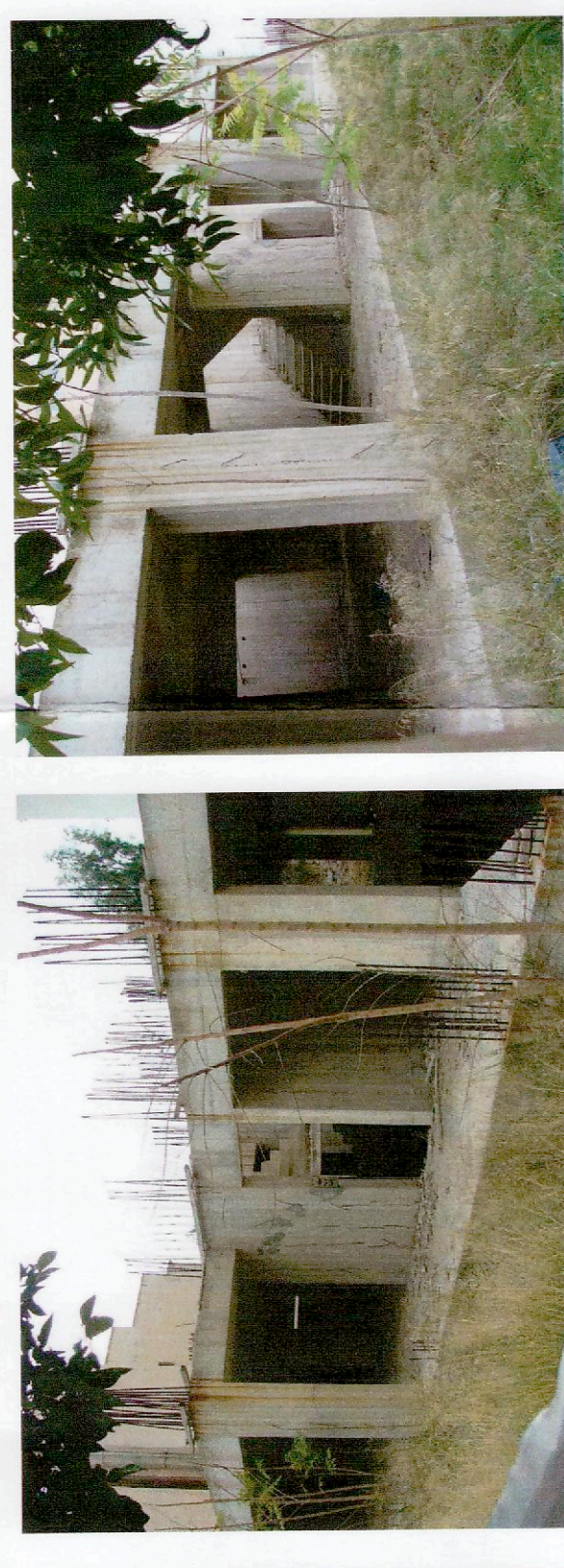
ΒΟΡΕΙΟΔΥΤΙΚΗ ΟΨΗ, ΦΩΤΟΓΡΑΦΙΑ 2 ΒΟΡΕΙΑ ΟΨΗ, ΦΩΤΟΓΡΑΦΙΑ 3

Παρατηρήσεις: 1. Το διαγράμμα είναι ενταγμένο στο Κρατικό σύστημα συντεταγμένων ΕΓΣΑ '87 2. Οι διαστάσεις και το εμβαδόν υπολογίστηκαν αναλυτικά από τις συνιστώσες των κορυφών 3. Οι Ρ.Γ. & Ο.Γ. ορίζονται σύμφωνα με τα διαγράμματα ρυθμίσεως